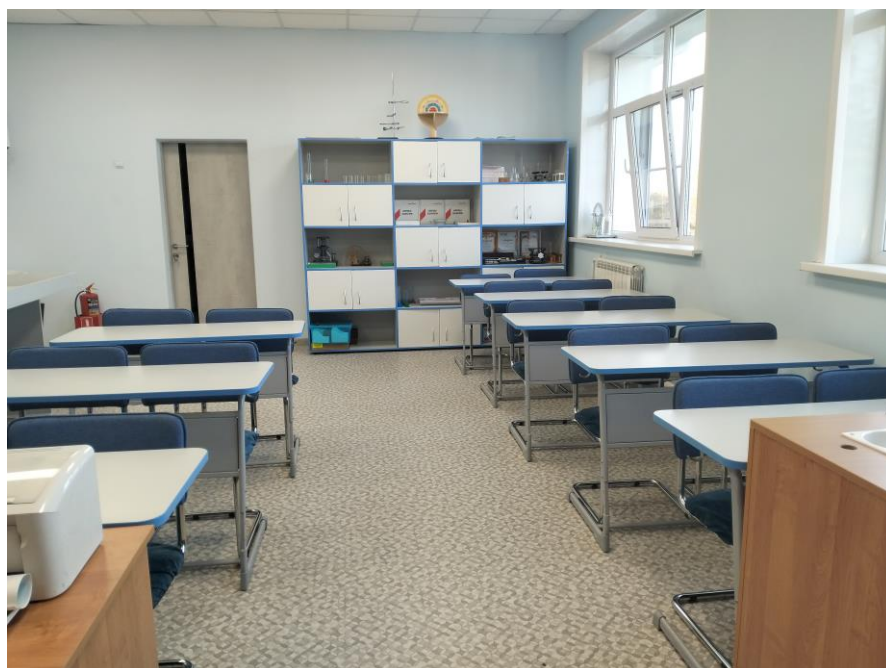
Кабинет физики, химии и робототехники.